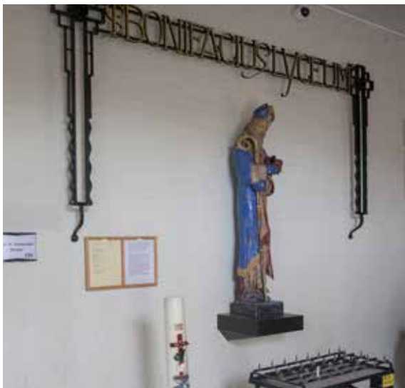
De bezinningsplek rondom het beeld van St Bonifatius.