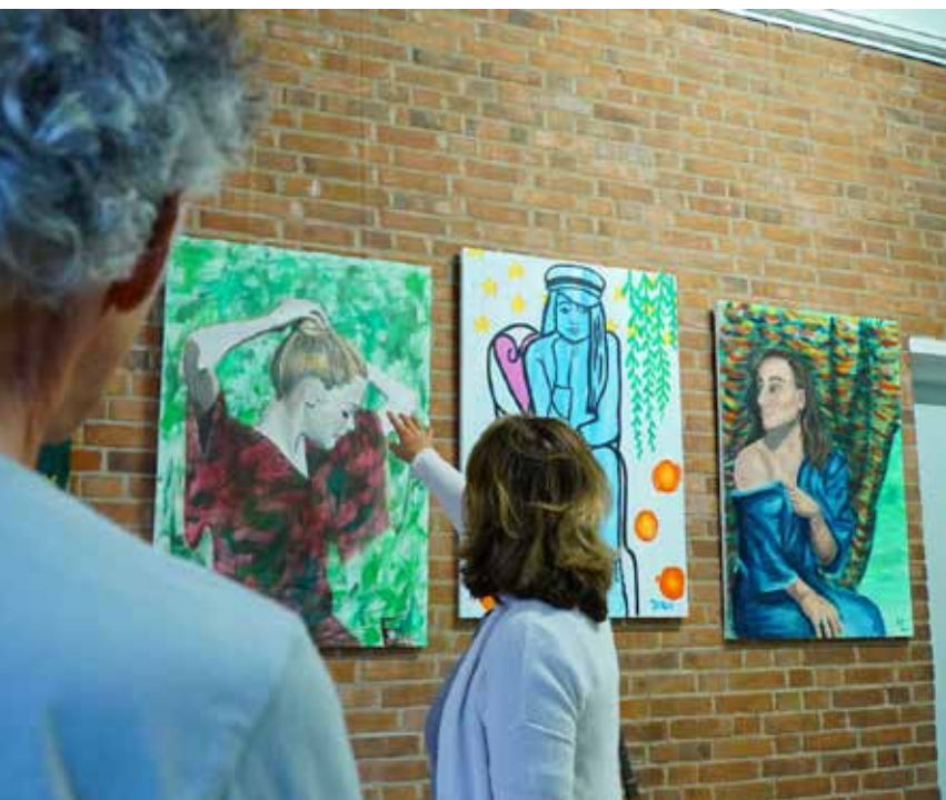
Schilderen bij Atelier 306

De Boni Talent Uren worden bij de leerlingen op verschillende manieren onder de aandacht gebracht: op school krijgen leerlingen informatie en gaan sommige docenten de klassen langs om hun activiteit te promoten, en er gaat een brief naar de ouders. Leerlingen worden dus van verschillende kanten geïnformeerd en