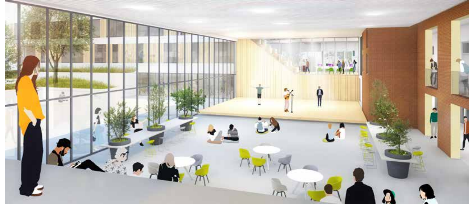
De nieuwe aula wordt verdiept aangelegd.

Schreuder: "Door de gefaseerde aanpak blijft er bijna altijd voldoende ruimte om de school gewoon door te laten draaien. Voor de gymlessen moeten we een tijde-