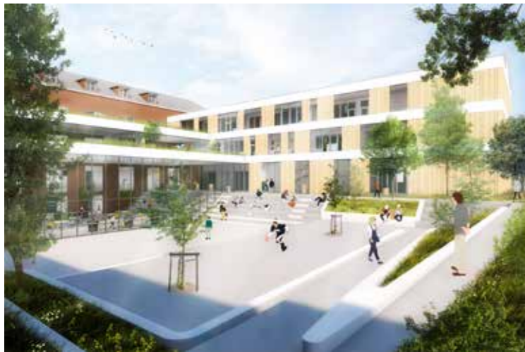
Overzicht van het vernieuwde schoolplein, de aula en een verbrede vleugel.