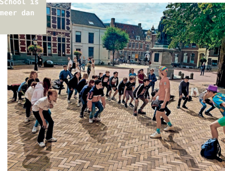
Deze klas kreeg ochtendgymnastiek op het Domplein.

Een tweede thuis op het Boni. ‘School is zoveel meer dan lessen’