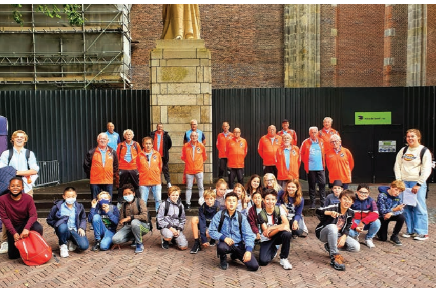
Ook op het Domein: een ontmoeting met oud-FC Utrechtspelers.